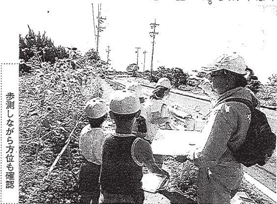
歩測しながら方位も確認

【宇都宮】宇都宮市昭和1-7-9 【水戸】水戸市南町2-5-24 【仙台】仙台市青葉区上杉1-6-10