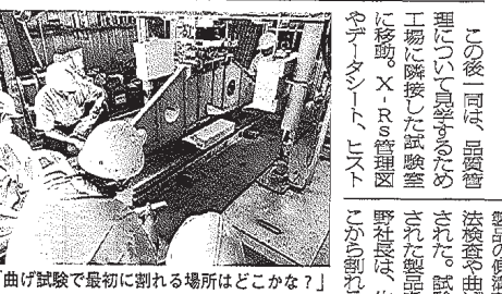
曲げ試験で最初に割れる場所はどこかな?

【宇都宮】宇都宮市昭和1-7-9 【水戸】水戸市南町2-5-24 【仙台】仙台市青葉区上杉1-6-10