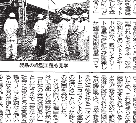
製品の成型工程も見学

【宇都宮】宇都宮市昭和1-7-9 【水戸】水戸市南町2-5-24 【仙台】仙台市青葉区上杉1-6-10