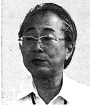
講師の丸山本部長