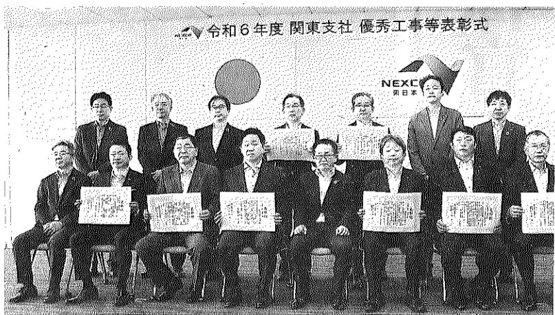
令和6年度 関東支社 優秀工事等表彰式 記念撮影に臨む支社長表彰・優秀工事の受賞者ら